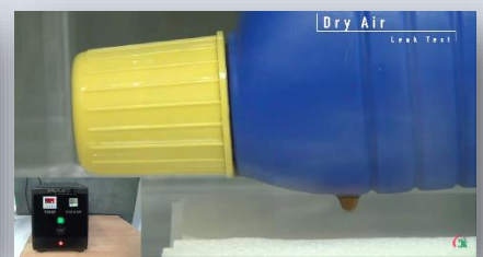
Empty Rigid Containers